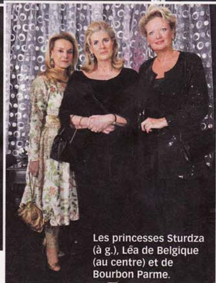
Les princesses Sturza (à g.), Léa de Belgique (au centre) et de Bourbon Parme.