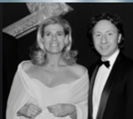
SAR Léa de Belgique et M. Stéphane Bern